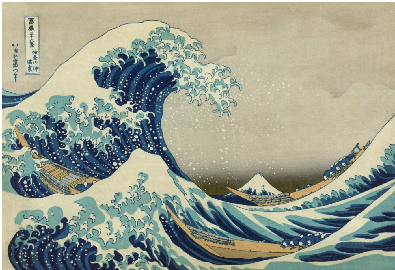
“La grande onda al largo di Kanagawa”, 1830 circa - Katsushika Hokusai - Metropolitan Museum of Art, New York

“Ma dov'è pericolo, cresce anche il salvifico” Friedrich Hölderlin, Patmos