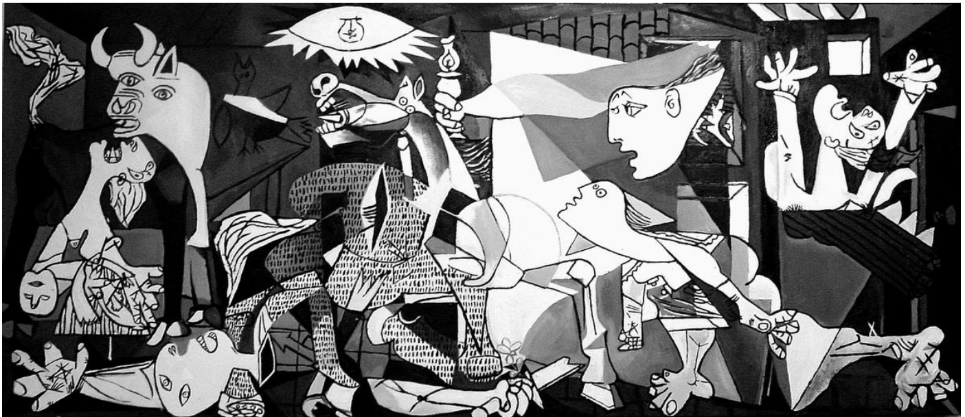
Pablo Picasso - Guernica: Olio su tela 3,49 x 7,76- Madrid, Museo Nacional Centro de Arte Reina Sofia.

Il Servizio Formazione e Sviluppo Risorse Umane della ASL BI, grazie alla collaborazione degli operatori della Biblioteca Biomedica 3Bi, avvierà prossimamente un servizio informativo scientifico in favore dei professionisti impegnati nella fase di emergenza COVID-19 che stiamo vivendo.