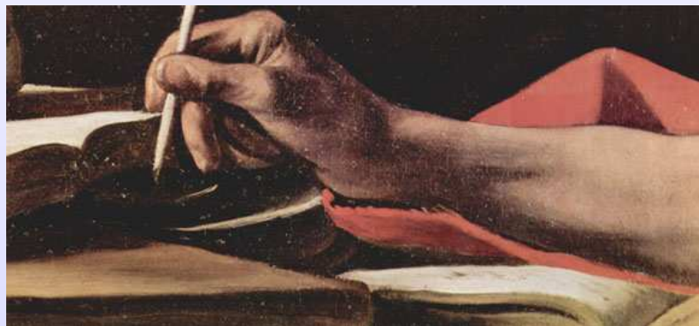
Particolare tratto da "San Girolamo" Caravaggio 1606, Galleria Borghese, Roma